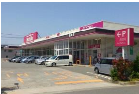
マックスバリュ まで徒歩約5分